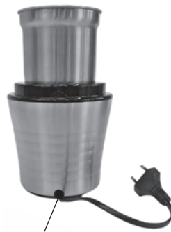
Прорезь для выхода шнура