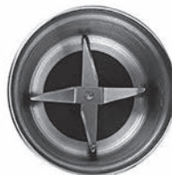
Чаша для специй