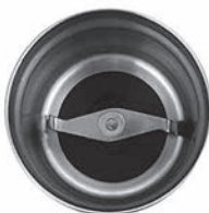
Чаша для кофе